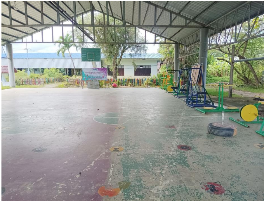
ลานกีฬาและสถานที่ออกกำลังกาย หมู่ที่ 1 สถานที่ รร.วัดบ้านมอญ